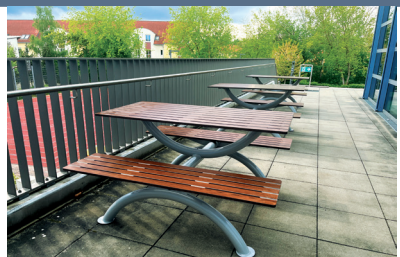
Sitz-Tisch-Elemente (7.000 €)