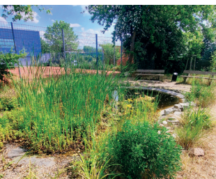
Biotop (600 €)