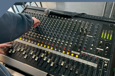
Unterstützung der Technik-AG (800 €)