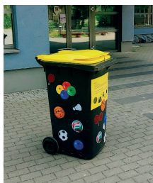
Balltonne (500 €)