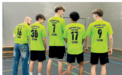
Wettkampf-Trikots (500 €)