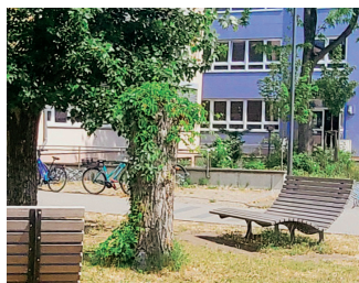
Liegen, Hockerbänke (10.000 €)